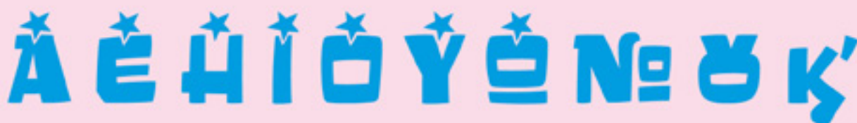
ΕΙΔΙΚΟΙ ΧΑΡΑΚΤΗΡΕΣ / SPECIAL CHARACTERS